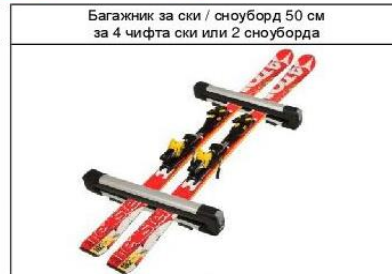
Багажник за ски / сноуборд 50 см за 4 чифта ски или 2 сноуборда