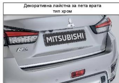
Декоративна лайстна за пета врата тип хром