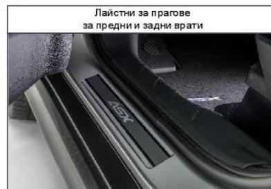
Лайстни за прагове за предни и задни врати