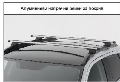
Алуминиеви напречни рейки за покрив