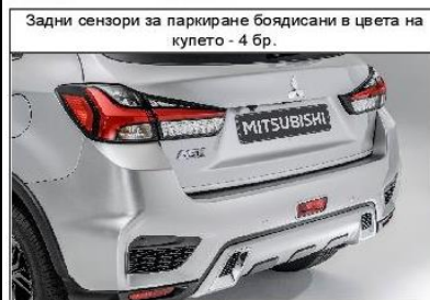
Задни сензори за паркиране боядисани в цвета на купето - 4 бр.