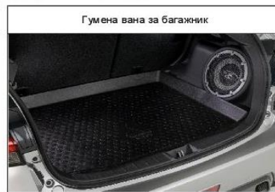
Гумена вана за багажник