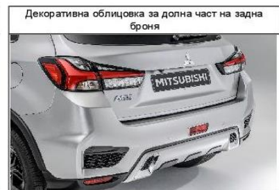
Декоративна облицовка за долна част на задна броня