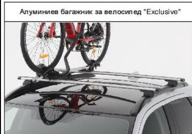
Алуминиев багажник за велосипед "Exclusive"