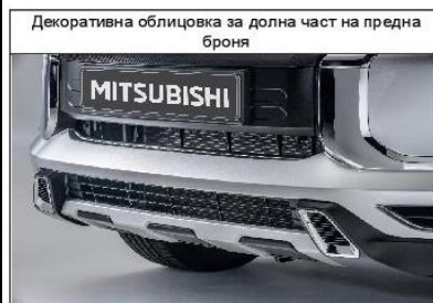
Декоративна облицовка за долна част на предна броня