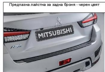
Предпазна лайстна за задна броня - черен цвят